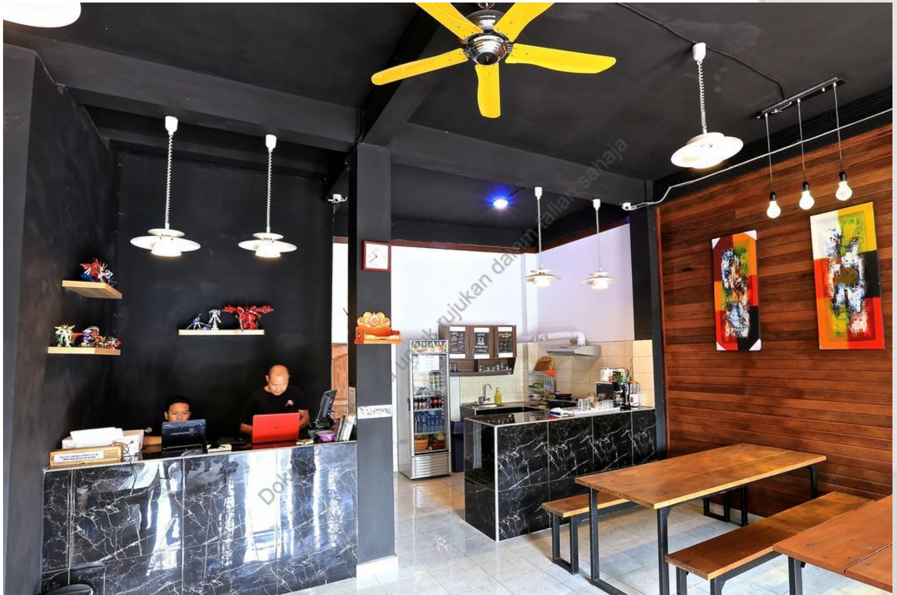
CONTOH 2 : KAUNTER PENDAFTARAN/ RUANG MENUNGGU