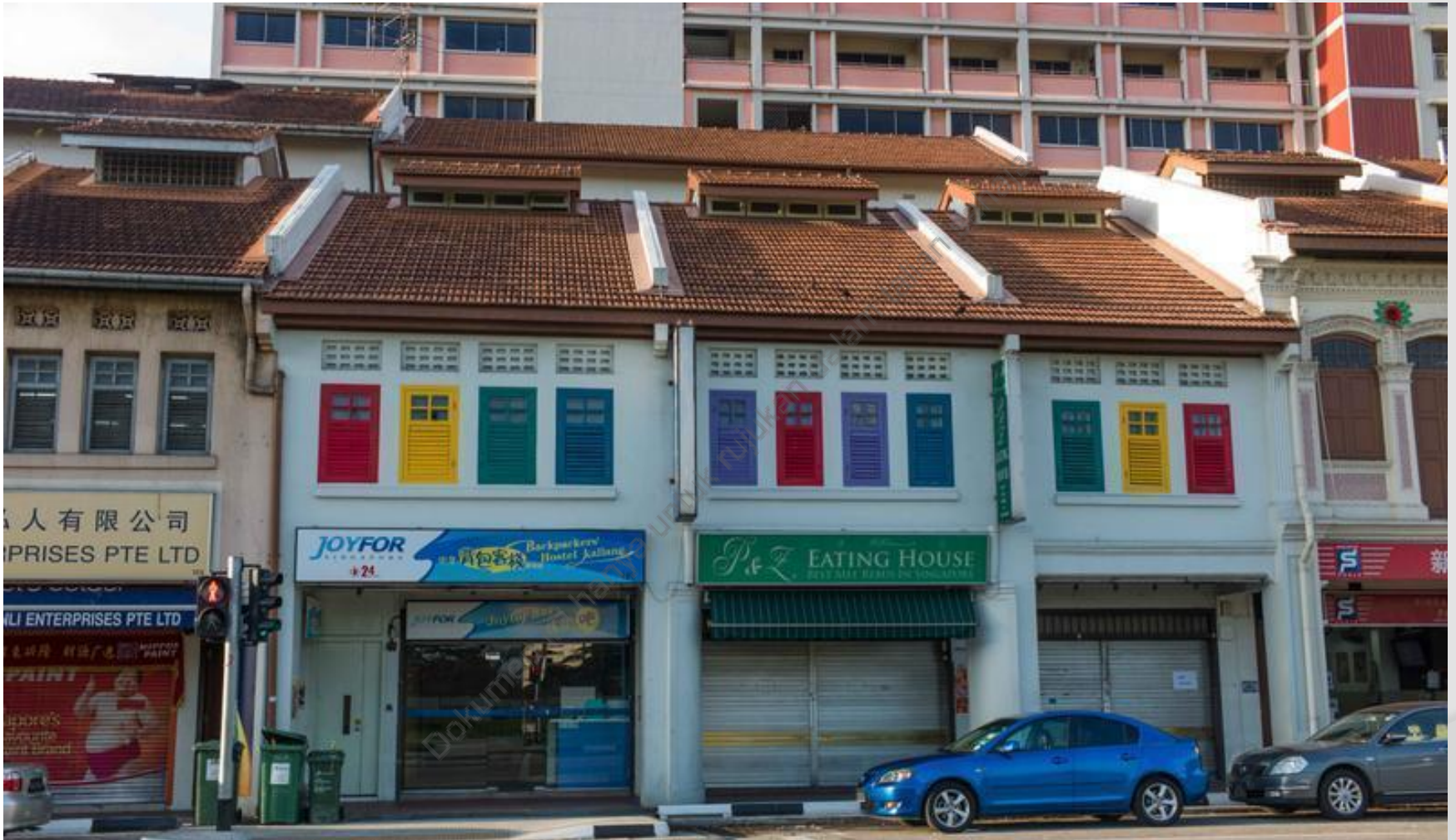
CONTOH 1 : BACKPACKERS HOSTEL DI RUMAH KEDAI SEDIA ADA