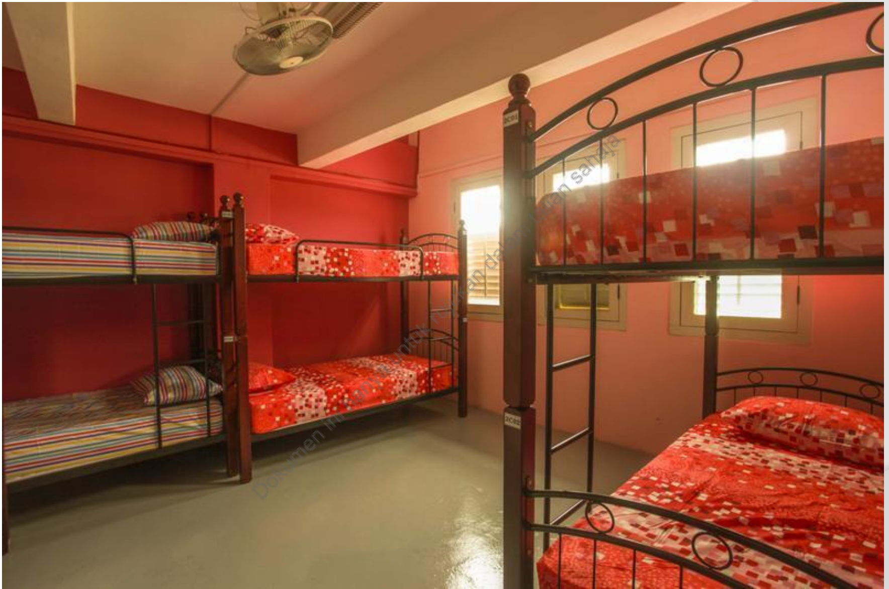
CONTOH 3 : RUANG TEMPAT TIDUR