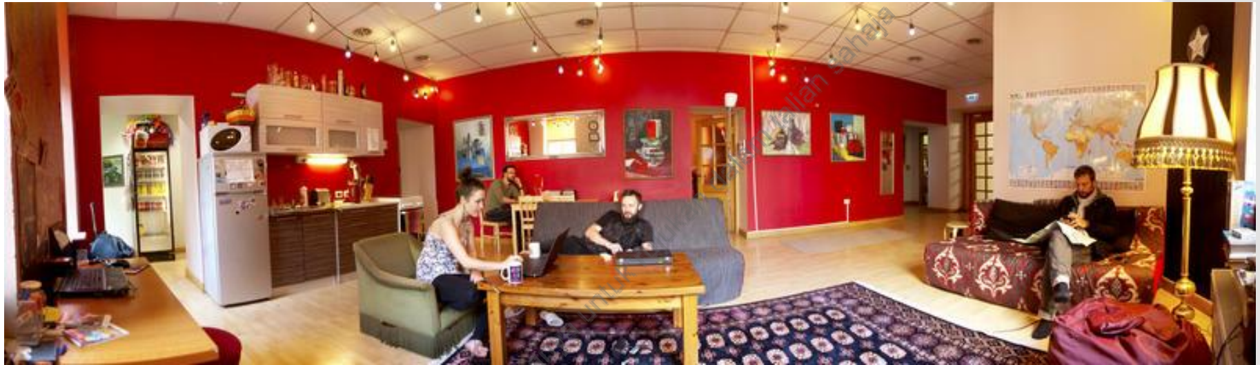
CONTOH 8 : RUANG DAPUR DAN 'LOUNGE'