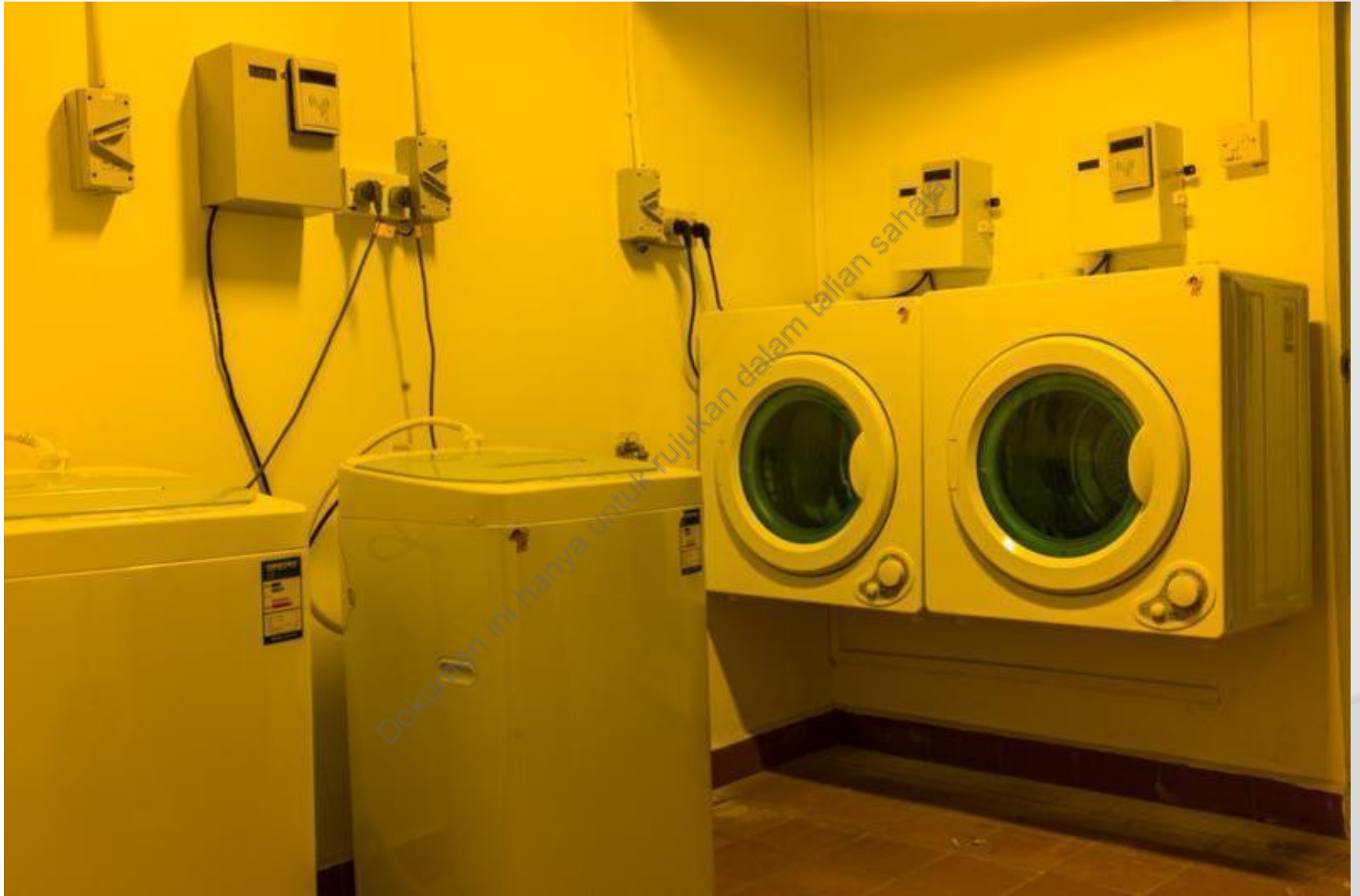
CONTOH 6 : RUANG DOBI