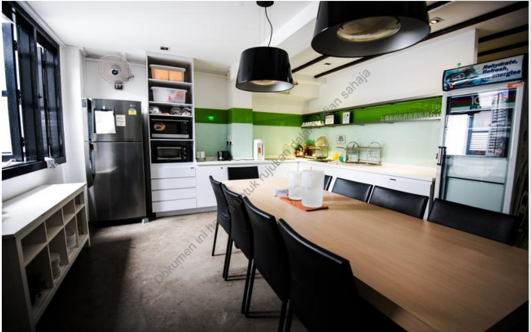
CONTOH 4 : MINI PANTRY