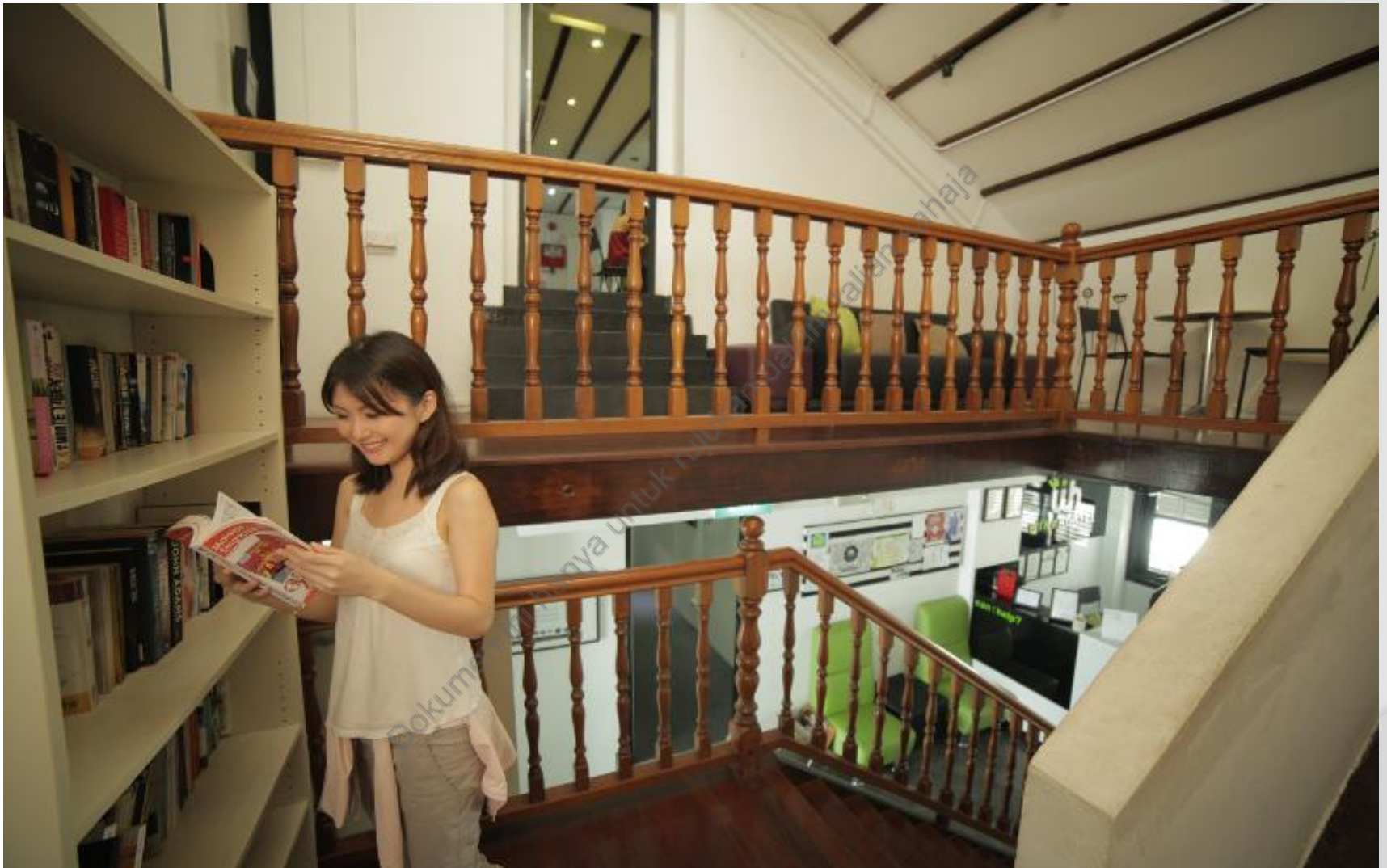
CONTOH 7 : SUDUT BACAAN