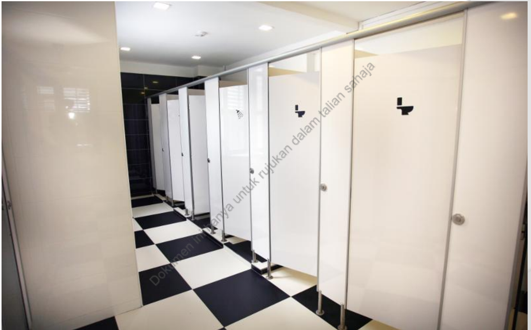
CONTOH 5 : KEMUDAHAN BILIK AIR